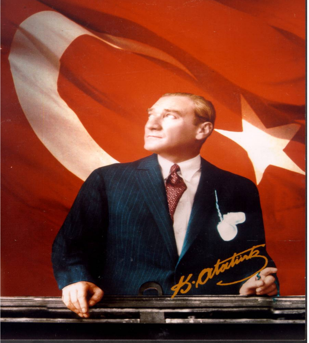
Mustafa Kemal ATATÜRK